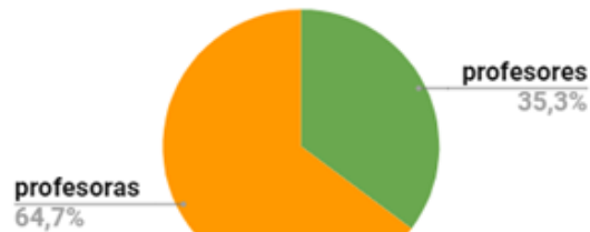
Características del profesorado participante en grupos de discusión