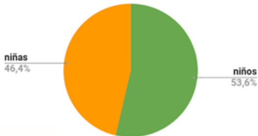
Características de los niños y las niñas encuestados/as